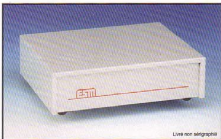
Livré non sérigraphié